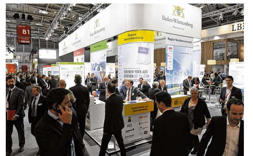
Reges Treiben herrschte an und um den Ostwürttemberg-Stand auf dem Baden-Württemberg-Pavillon.